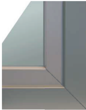
Gehrung 45° Standard Ausführung

Durch die vielen Oberflächenfarben der Alu-Schalen für alle Kunststofffensterausführungen in RAL matt, RAL Feinstruktur, Metallic- und Holzdekoren (siehe Seite 38) sind die ISARHOLZ-Kunststoff/Alu-Fenster beliebte Gestaltungselemente für schöne Fassadengestaltungen. Dieses tendenziell in Verbindung mit ISARHOLZ-Alu-Haustüren in gleicher Farbgebung. Populär für die Optik moderner Architektur und für den Austausch von Holzfenstern (Wahrung des Holzfensterdesigns) sind die ISARHOLZ-Kunststoff/Alu-Fensterausführungen mit stumpfen Stoß.